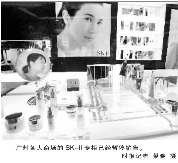
广州各大商场的SK-II专柜已经暂停销售。

至于SK-II何时在中国重新恢复销售,宝洁中国有关负责人表示目前还没有消息。当记者问到这是来自于美国总部的决定还是大中华区的决定时,这位负责人表示这是全球SK-II以及中国方面一起作出的决定。