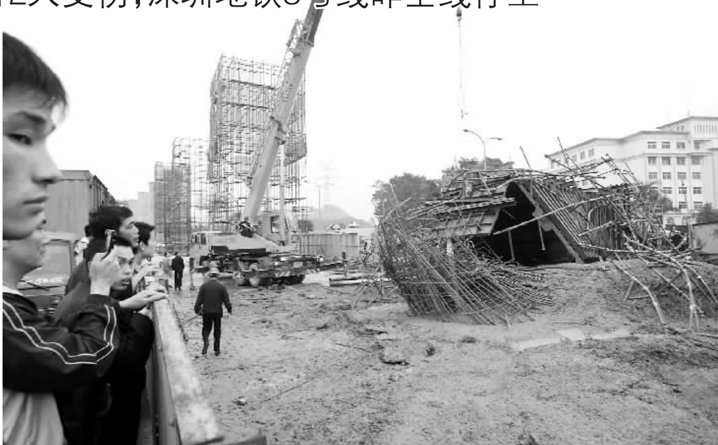
事故地点位于深圳龙岗区荷坳村,现场遍布散乱的钢筋。