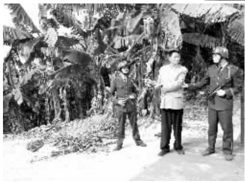
嫌疑人指认下水地点。

部门加大了对深圳周边海域的巡查力度,该团伙很有可能舍近求远,取道内河水域长途潜行,而广州南沙一带由于河道较多,船舶、码头密集,易于下水,成为该团伙的“理想”选择。种种迹象表明,两条线索所指的偷渡团伙应该是同一个团伙。于是,广州市公安边防支队迅速成立了代号为“斩蛇”的专案组,决定将两案并案侦查。