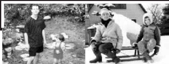
女儿学步时,迪伦已经成了真正的“父亲”。