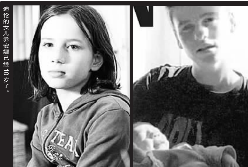
迪伦的女儿乔安娜已经10岁了。

对邻居们来说,迪伦只是一个疼爱女儿的单身父亲,而迪伦的同事们,也压根不知道他曾是一个女孩。