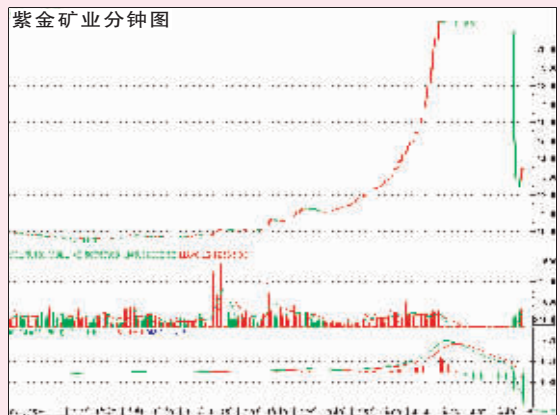
股指升跌牵动股民神经。