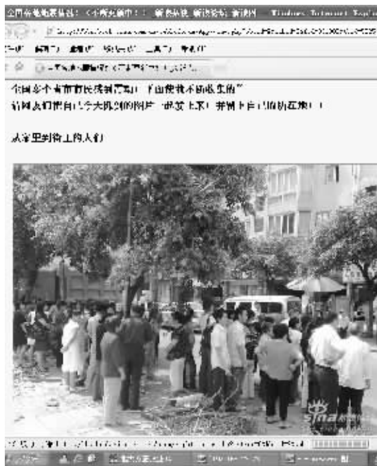
新浪论坛不断更新“各地网友实拍地震情况”,供各地网友介绍地震情况。同时新浪论坛网友也发出互动帖:地震了,你的第一个电话打给了谁?还有网友发帖为灾区人民祝福:祈福!为我们身在四川的同胞。

生措施,“提醒千万不要跳楼……”在诸如QQ、MSN等即时通讯和网络论坛上,网民们甚至开起玩笑,用幽默来化解地震带来的心理影响。