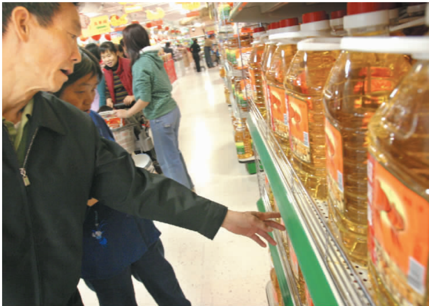
从去年以来,食用油一路看涨,市民买油总要掂量掂量。