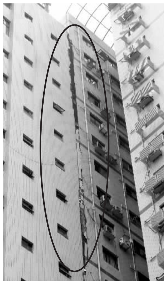
成都市一栋高层建筑出现了巨大裂缝(圈中)。