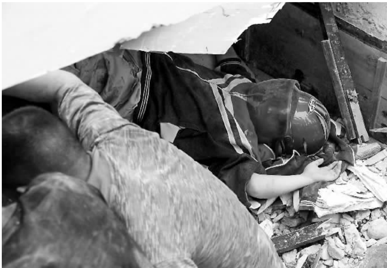
至昨日 19 时 56 分,都江堰市聚源中学事故现场死亡人数已增至 50 余人。图为众人正在奋力抢救一名被压住的学生。