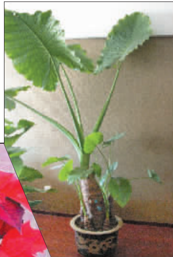
▶ 滴水观音在家庭摆设很普遍，但是毒性对人有一定伤害。