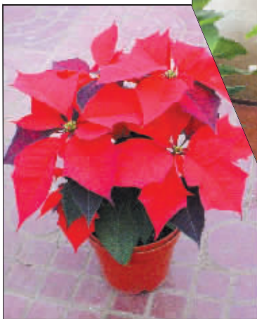
◀ 一品红，多数人都放在户外。