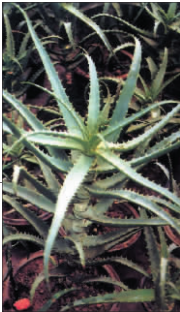
▶ 芦荟本身的价值高，家庭种植之余还可以美容

当然，在家中放置鲜花从观赏角度或者陶冶性情都是一件好事。但如果知道自己命格里面的属性而有所选择，在堪輿学上来说就是寻求一种人与植物间的和谐。例如你的命格里面属木的，那么无论何时何地都适合插花，当然已婚人士则有可能惹来桃花劫，所以人人都有所不同。