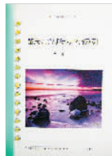
五年级小学生自己印的徒步旅行记开启新生代印客风潮。

不过,如果能取得由新闻出版部门发放的准印证,个人印书就比较方便、放心。广东省新闻出版局的政务大厅就受理准印证业务,一般 20 个工作日能够办妥。申请人只需填好准印证申请表上交,如果印刷品不涉及重大题材或敏感内容的,连书稿也不必经过审查。但要提醒的是,准印证目前还不接受个人申办,个人必须通过所在单位或者行业协会来申请。