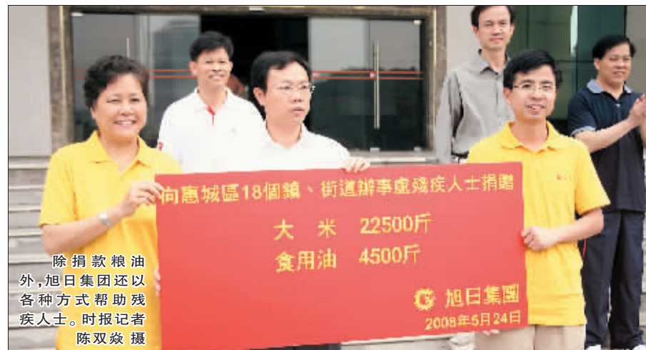
除捐款粮油外,旭日集团还以各种方式帮助残疾人。

时报讯 (记者 任旭东) 5月24日上午,旭日集团爱心人士捐赠慰问惠城区残疾人仪式在惠城区行政中心举行。区委常委、宣传部长梁冠斌出席活动并代表区委区政府向旭日集团回赠了爱心