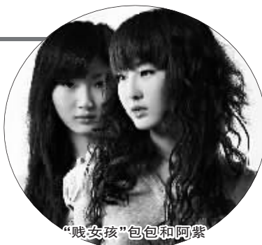
“贱女孩”包包和阿紫

而就在昨日,北京一家媒体的记者前往“源源影视”办公地点采访时,发现其办公室已经大门紧闭,而该公司所在大楼的保安也称,见到有该公司的女孩搬走3部电脑和一些被褥。