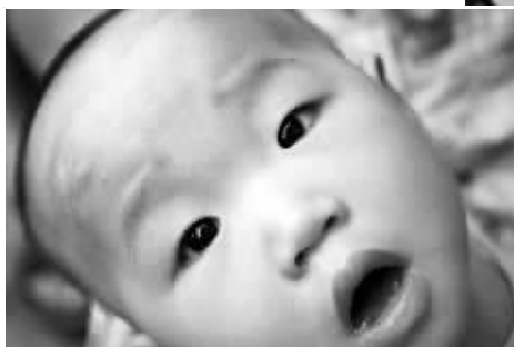
▲▶ 这起事件发生在2007年2月10日,当时母亲正抱着孩子从芳村区鹤园中十四巷二号门下走过。(资料图片)