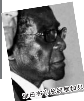
津巴布韦总统穆加贝

时报讯 据《中国日报》报道,据英国媒体6月5日报道,津巴布韦的将军们已悄悄发动军事政变,总统穆加贝已沦为有名无实的“傀儡”。