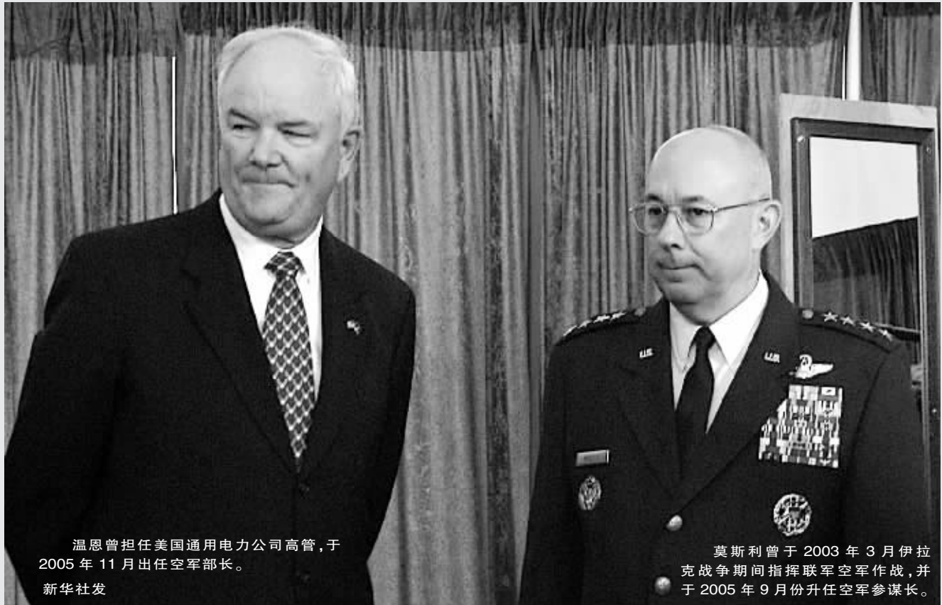
温恩曾担任美国通用电力公司高管,于2005年11月出任空军部长。