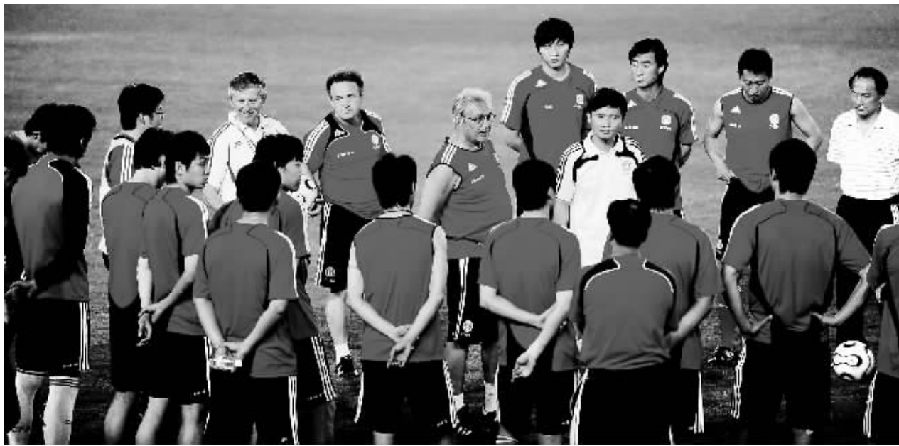
中国队欲以进攻阵容应对本场比赛，力争全取3分。