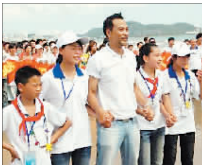
任达华当天一下飞机就赶来和小朋友们一起参加传递仪式。

结束了海南岛的活动,华仔接下来就要赶到北京工作,途中与身边友人谈及在四川看到那些灾区群众急需帮助的情形,希望大家能持续关怀他们,给予他们精神支持和鼓励。此外,华仔也很担心救灾人员在看了这一幕幕惨状后,是否可以承受这么大的心理压力,认为他们同样需要大家的关爱与鼓励。