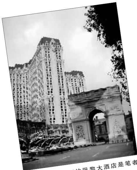
拉斯维加斯的巴黎大酒店是笔者比较推崇的堪舆格局。