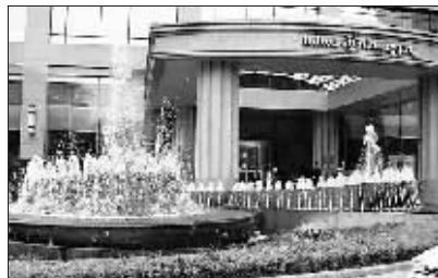
酒店大门口水景的“螺旋吸财机”。

“玉带”恭送四方财气涌向体育馆,财气直下“玉带”中,如何将其收入酒店大门最为关键,他们的办法是,用“螺旋体”的水池来形成“螺旋气场”,把旁边和溢上的财气统统吸收过来,所以,酒店大门口水景的就是两台“螺旋吸财机”,其酒店大门每天都是车水马龙,每日客满。酒店的明堂(大门前的空地)太窄,是一大弱点,所以它在大门的最前方用了一组五个小喷头向酒店字牌喷水的布局,意在扩大明堂的视觉效果和寓示五方来财涌向酒店。