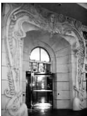
巴黎大酒店的入口保留其内气,阻挡外在恶气。