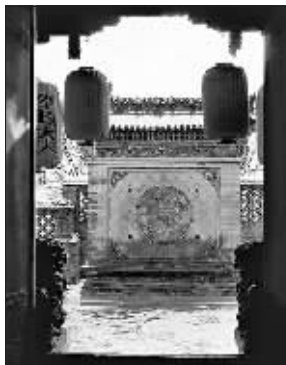
四合院在入口处总有影壁,以防漏气。