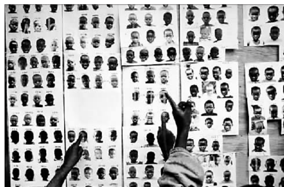
在卢旺达寻找孩子的人们。

维吉拍摄风格也极为特殊——清一色使用闪光灯，无论是受害者的尸体还是白天衣着光鲜的名人都在镜头前赤裸裸地曝光，几乎没有更多的技术含量，但有趣的是，他的这种没有传统新闻、摄影观念约束的拍摄方式，却被人认为是能够捕捉到镜头前最本质的人性表露——“用闪光灯剥掉人们的外衣”。苏珊·桑塔格说：“维吉的照片是对真实事物有帮助的地图。”今天，维吉被列为摄影史上五十个里程碑之一。