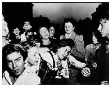
维吉的照片纪录了一个时代的人情百态

不可否认，摄影已经成为城市生活中的重要部分，我们随时在相片中记录自己的面目，有时，这些记录不经意中就会成为历史。今天我们要讲的两件事，就和旧世界有关。一件来自上世纪 50 年代纽约最具标志性的摄影师维吉，另一件还是关于灾难摄影，对于不幸，每个人都有自己的表现方式，而在卢旺达的自由摄影师瑞泽，却以他独有的方式，展现了希望。更多发现在这个新时代被展现出来，由此成为人们关注的新焦点。