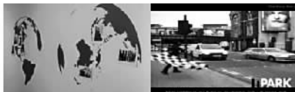
我们就生活在地球这层皮上，而更多的人，除了一层皮，再无其他特征，崔广宇的表皮计划延伸到世界各地。

目前，崔广宇还在这个表皮生活圈的游戏，这个台湾最红的新媒体艺术家，将他的表皮生活延伸到伦敦、利物浦到阿姆斯特丹，他将穿上更多的表皮，去探寻我们生活的实质。