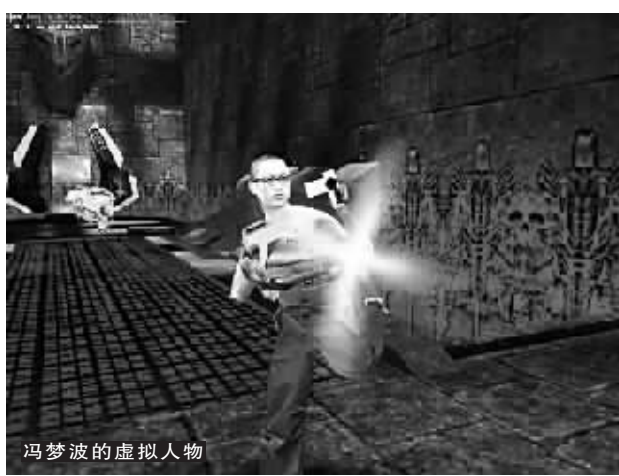
冯梦波的虚拟人物