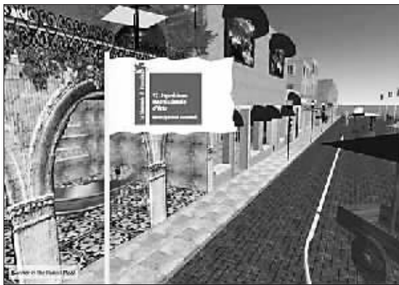
虚拟街道对现实街道的模仿