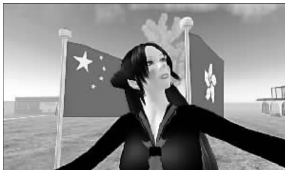
在虚拟城市中游荡的中国翠西

这次，我们要提到的冯梦波、曹斐和崔广宇就是其中具有代表性的艺术家，冯梦波、曹斐巧妙地利用互联网在生活中的影响，而纪录下了人在网中的记忆。而来自中国台北的崔广宇则是城市文化中诙谐又严肃的实践者，他用数分钟的时间，就能向你演示我们如何在身份的表皮下生活。