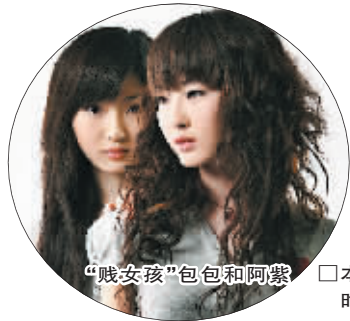
“贱女孩”包包和阿紫