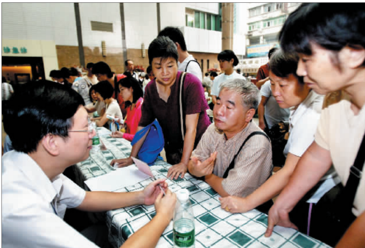
6月3日,在广东省中医院门口,前来咨询广州市城镇居民医疗保险的市民络绎不绝。(资料图片)

此外,提醒参保人“选定医疗机构”必须在能够使用本市医保信息系统进行门(急)诊费用记账并签订了居民医保补充协议的社会保险定点医疗机构中,选择具体名单可查阅广州医保网(网址:www.gzyb.net);选点手续在拟选定医院就诊时办理,无需提前办理;选点确认后在一个社保年度内原则上不予变更;确因特殊情况需要变更的,需持有证明材料到市医保中心办事处办理变更手续。选点变更于次月1日起生效。