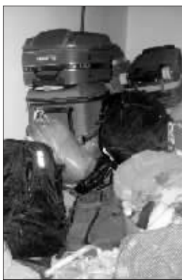
这个7人诈骗团伙在出租屋内堆放骗来的行李。

为掌握该团伙的犯罪事实及落脚点,专案组民警便衣出击,一路走街串巷寻找群众获取线索,另一路前往火车站及省、市长途客运站布控。经连日摸底排查,专案组摸清了团伙人员在广州市新市萧岗村内多个出租屋落脚。6月27日晚,新市派出所黄所长带领办案民警直扑嫌疑人聚集地点,当场在出租屋内抓获蒋×喜、蒋×瑞(均为湖南人)等3男4女共7名诈骗嫌疑人,并从屋内缴获涉嫌赃物的行李箱7个、旅行袋13个及手提袋6个,里面全是各种衣物、被褥等生活用品。目前,