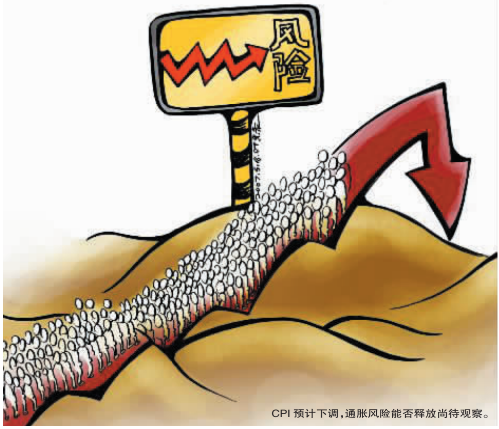
CPI 预计下调,通胀风险能否释放尚待观察。

国内宏观经济今年增速回落目前几乎没有争议,国内外不少机构都将GDP增速从11%调到10%,甚至悲观者认为8%~9%左右,经济的回落必然引起国内企业盈利能力的降低。根