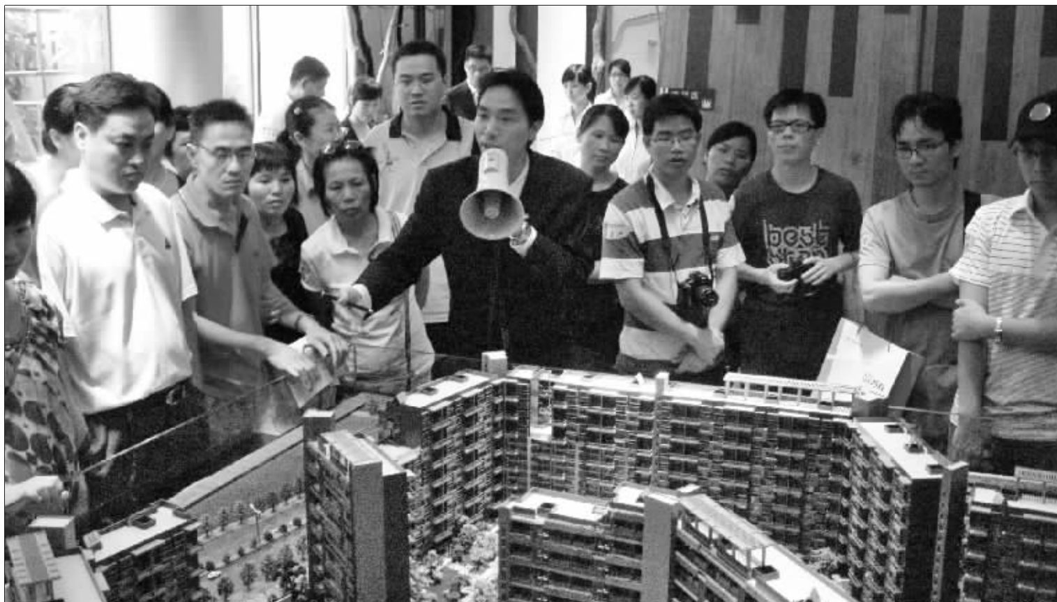
在资产不断缩水的情况下,专家建议持有房产等实物资产,以抵制通胀。

而把钱放在家中,则损失更大。有人倾向于储备大量生活用品,如米、油等,但因为这些物品的价值较低且不易保存,避险的效果实际非常有限。