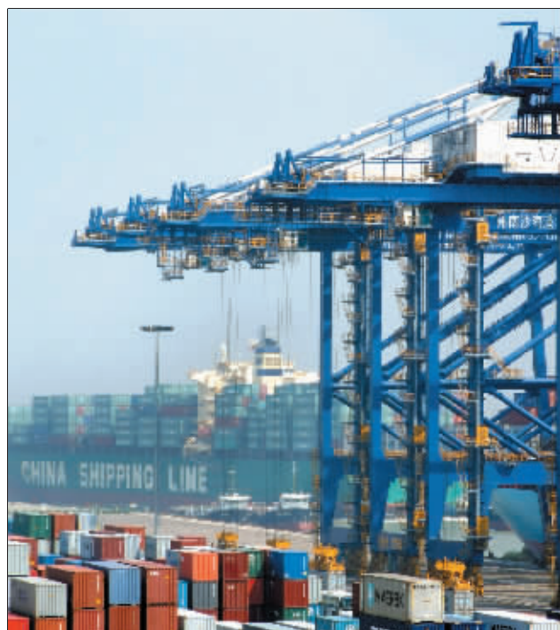
高油价导致的成本上涨，令物流企业不堪重负。

截至昨日下午3时，国际油价收报137美元，跟上周创下的历史高点146美元相比，已经下降了9美元，不过，华尔街投行摩根大通和雷曼兄弟周二均表示，原油期货本月可能达到150美元，而年内则将保持在115美元上方。对于深受影响的行业来说，寒冬或许才刚刚开始。