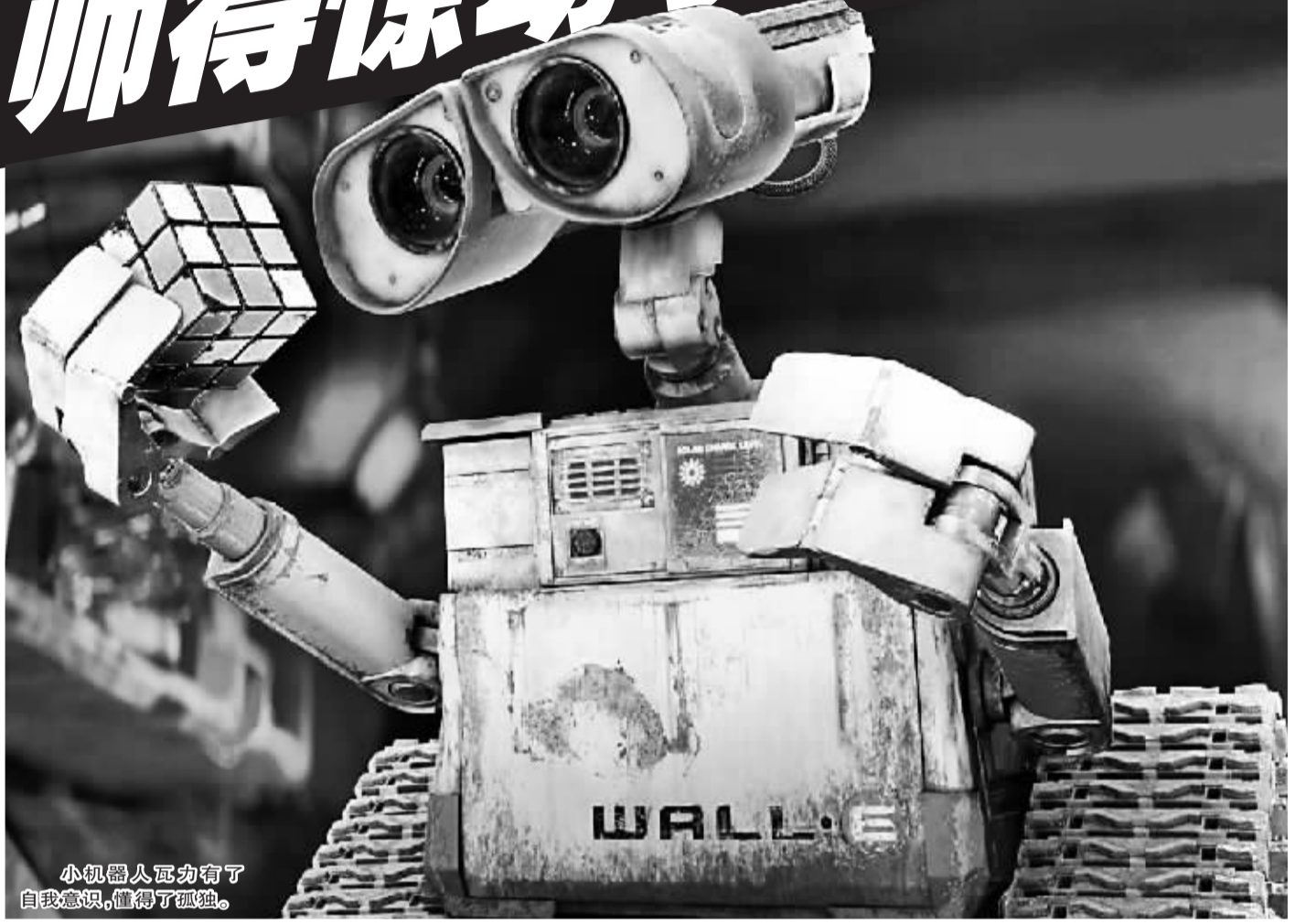
小机器人瓦力有了自我意识，懂得了孤独。

因为奥斯卡一向有自己的评选标准，所以虽然之前的动画片叫好叫座都未能如愿登顶最佳影片。此番《星际总动员》(英文片名“Wall·E”，也译作《机器人总动员》)要想成功也并非一路坦途。除了要同同为动画片的《与巴什尔共舞》角斗，还要战胜一向对奥斯卡口味的真人影片。