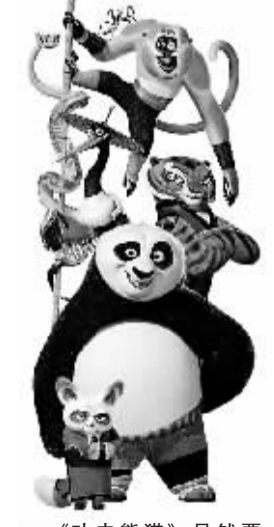
《功夫熊猫》虽然票房很好，但肯定不入奥斯卡法眼。