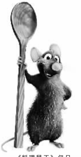
《料理鼠王》仍只获最佳动画片。