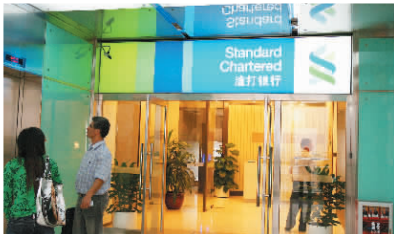
渣打等外资银行积极推行中小企业贷款。

上半年受人民币升值和信贷从紧影响,原本处于融资困境的中小企业更是雪上加霜,珠三角不少企业纷纷宣布倒闭破产。但是,“苦日子总有出头的时候”。近日,银监局和工行、国开行的领导纷纷向市场发出信号:下半年将重点扶持中小企业,信贷天平有望向中小企业倾斜。而记者从花旗、渣打等外资银行同时获悉,外资银行也纷纷向总部申请,希望能将中小企业贷款门槛逐渐放低,通过多样化的融资产品满足中小企业的个性化需求。