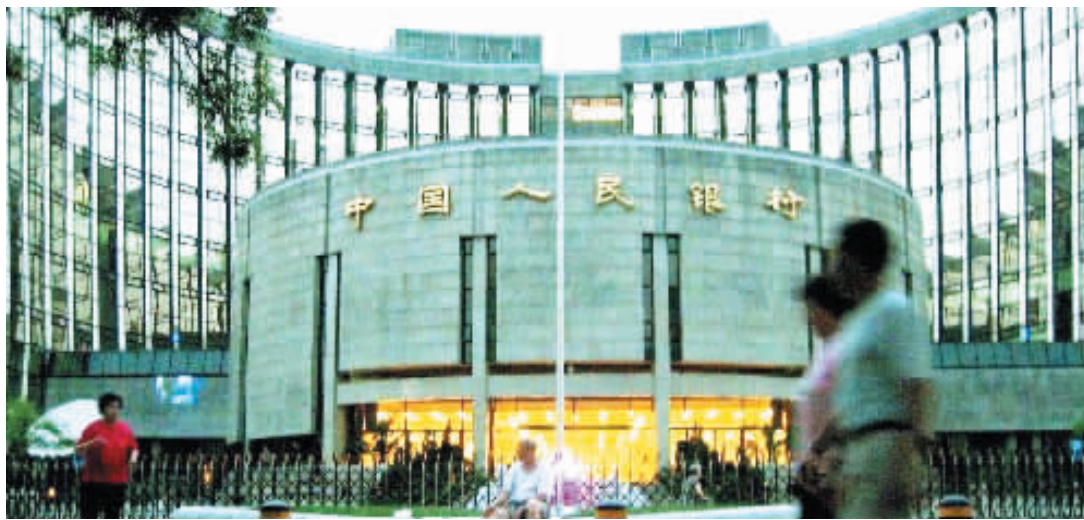
中国人民银行。(资料图片)

分析人士则认为,政策的微调不代表转向,宏观调控的从紧基调并没有出现大的变化,中小企业、纺织企业的信贷放松、弱势群体的财政补助将成为下半年政策放松的重点,而不会对地产、钢铁、化工等行业的银根放松。