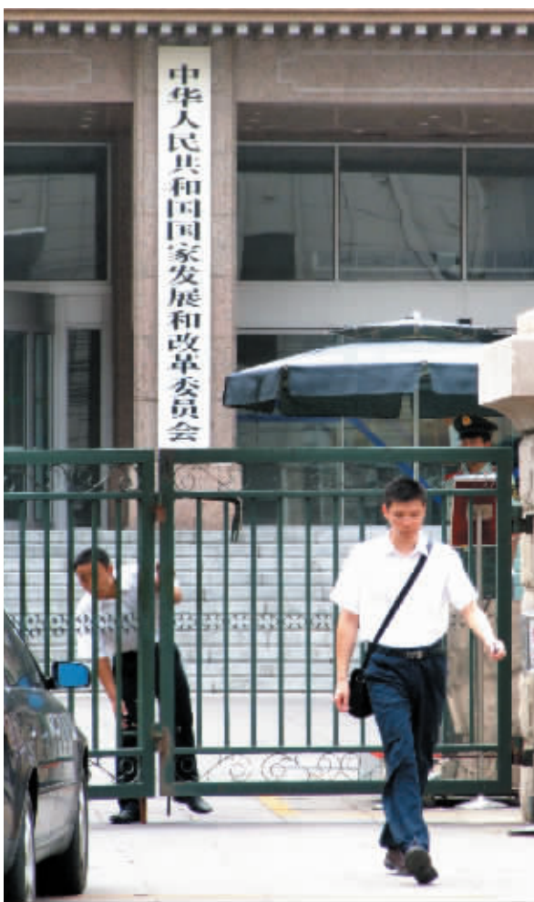
国家发改委。

上述意见已经获得国务院批准。意见中提到的2008年经济体制改革重点任务还包括,将深化金融企业改革,推动金融资产公司转型,积极稳妥推进创业板市场建设,逐步完善成品油、天然气价格形成机制等。