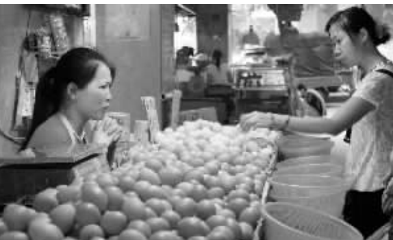
在南华西路某肉菜市场,鸡蛋的零售价为4.2元。

时报讯 (记者 赵安然 实习生 李蕴贤 陆璟) 让老广提心吊胆了近两个月的菜价持续走低,且“跌势”丝毫没有受到强热带风暴“北冕”的影响,上周蔬菜