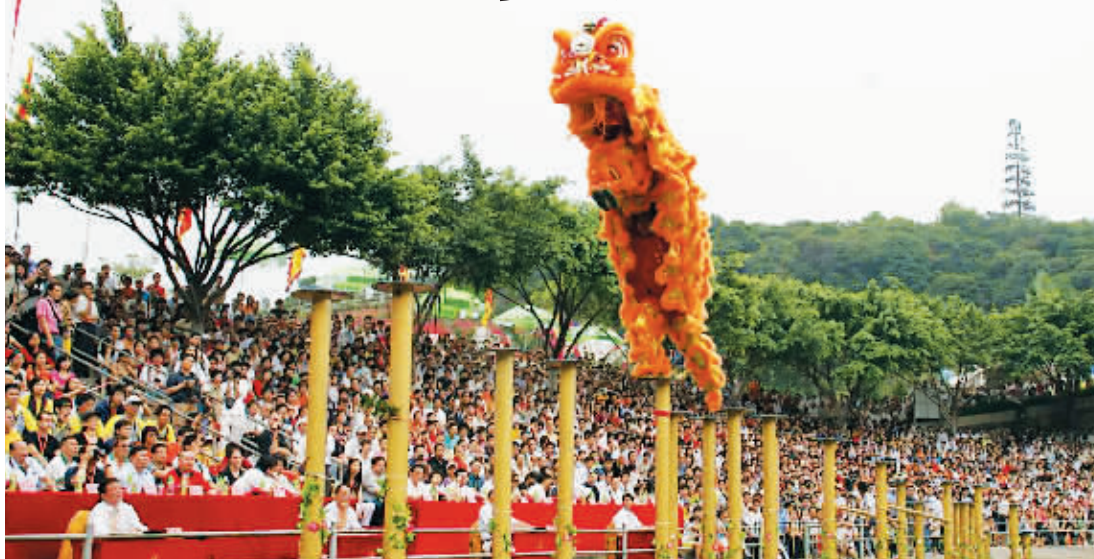
狮王争霸已经成为西樵山旅游品牌。今年国庆,众狮队将在此角逐奥运狮王桂冠。

该协会昨起向全世界几百个龙狮运动协会广发英雄帖。主办单位表示,将根据各队规模、技术、实力、战绩等遴选出10支以上的狮队参赛。