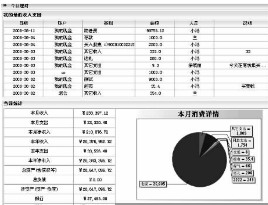
这是一个记账网站自动为用户生成的财务收支图表。