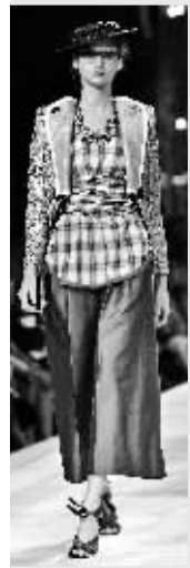
围裙式的格子上衣加男装眼镜,Marc Jacobs这款料理除了玩色彩外还有点Geek(技术狂热者)的味道。