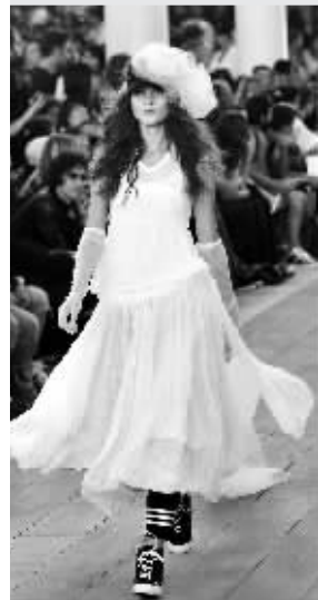
白裙里穿黑色运动裤是 Y-3这次呈现的解构概念。