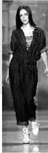
DKNY的连身阔脚工人裤。