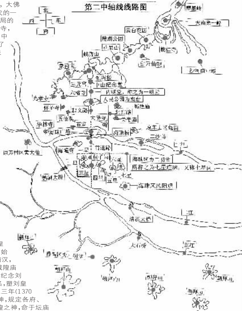
张志伟、何凤诗制图。

关羽的祠庙遍布神州大地。要说中国什么庙最多,关羽庙当之无愧。关羽不仅受到儒家的崇祀,同时他又受到道家、佛家的顶礼膜拜,这更加助长了关羽祠庙的修建。不论是儒家的关羽、道家的关羽还是佛家的关羽同样受到老百姓的祭拜,三教之中所体现的更多的还是儒家关羽的本色。