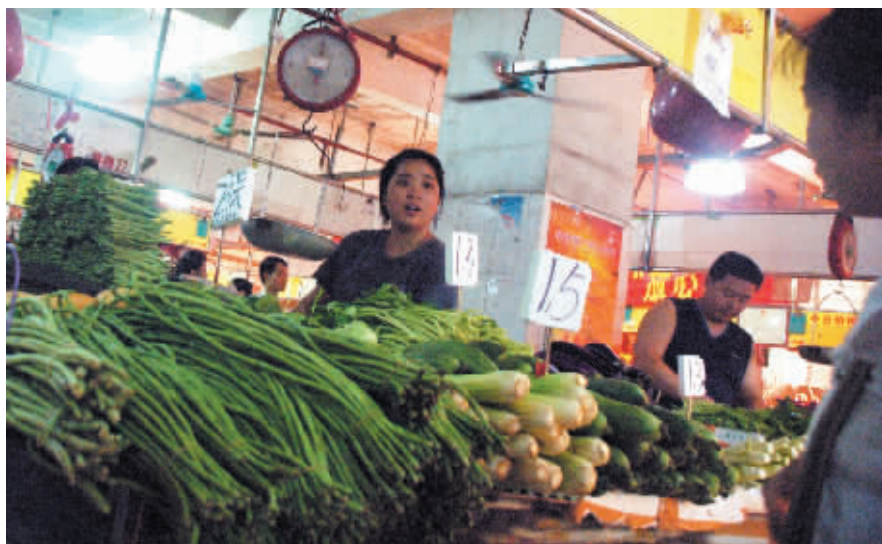
中秋期间如果天气持续稳定,外地蔬菜补充及时的话,预计蔬菜价格基本稳定,不会出现较大的波动。

据广州最大的活禽交易市场——广州百兴三鸟批发市场相关负责人介绍,目前该市场活禽日交易量在22万只左右,较平常交易量上涨2~3成,活鸡整体批发均价为18.8元/公斤,较8月份上涨1.68%,其中中低档鸡如麻鸡、黄鸡批发价格比前期上涨0.5~1元/斤。随着节日期间广大市民对活禽需求量的增长,预计每斤活鸡整体零售均价将比平常上涨1~1.5元之间。