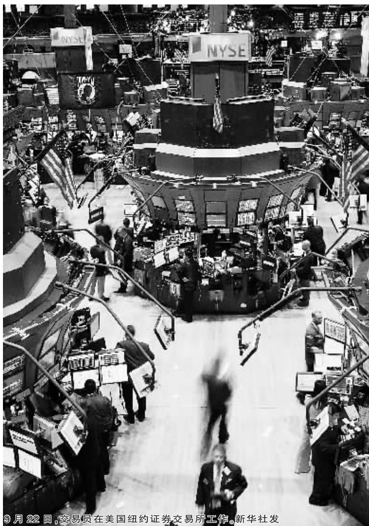
9月22日,交易员在美国纽约证券交易所工作。

由于投资者对美国政府大规模的金融救助计划心存疑虑以及国际油价前所未有的暴涨打压市场,9月22日纽约股市三大股指再次暴跌。道琼斯指数下挫近380点,标普和纳斯达克跌幅均在4%左右。