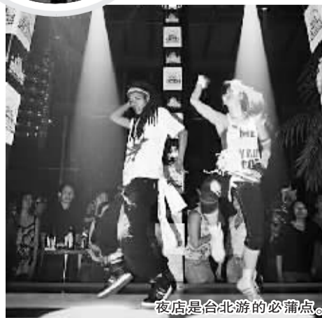
夜店是台北游的必蒲点。