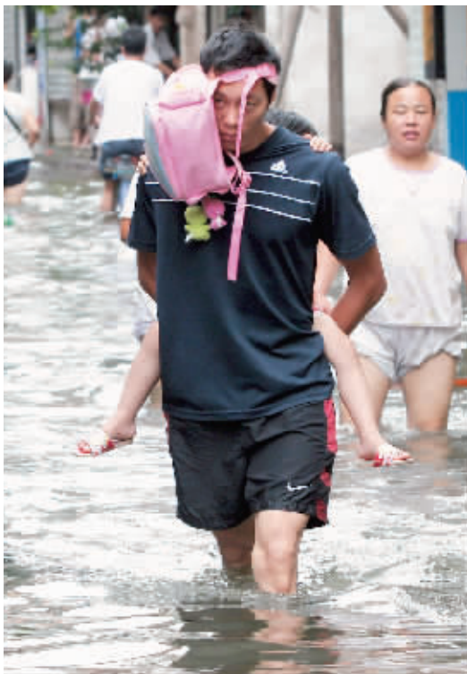
昨日，海珠区南田路附近居民区内水深到膝盖。一些家长背着孩子去上学。 见习记者 叶伟报 记者 朱元斌

早上8时许，陆续有小学生返校。有家长卷起裤筒抱着孩子到学校对面，也有老师和家长相互传送，想方设法让孩子安全到达课堂。很快，附近出现了一些骑三轮车的小贩。“多少钱？”一名家长问道。“2元钱。”家长立即将