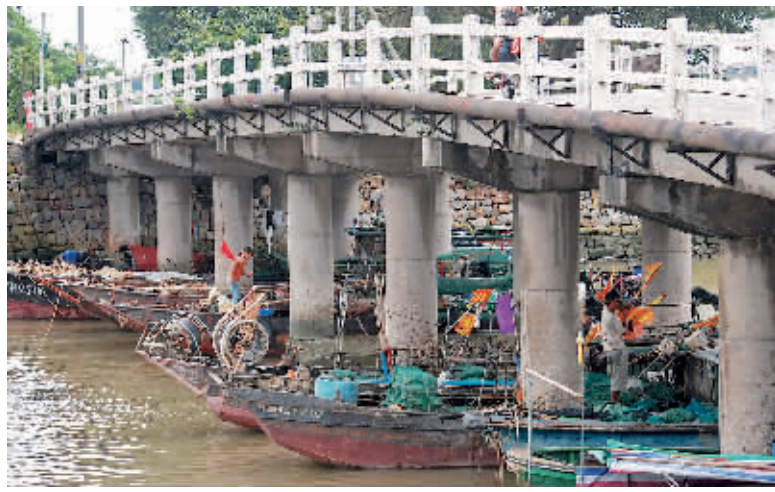
南沙十八涌停泊许多避风的渔船。

据悉，万顷沙镇上的幼儿园23日下午开始停课，昨日下午小学也陆续停课，预计雨势今天减弱后可以