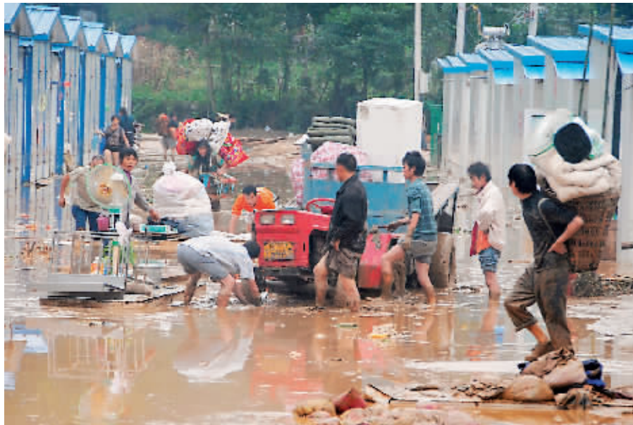
9月24日，北川县擂鼓镇的居民正在撤离被泥石流侵袭的板房区。

记者从北川羌族自治县重建委员会了解到，截至24日12时，自22日晚以来的连续降雨已造成该县2人遇难，30人失踪，300余人受伤，1100余间房屋(含民房、板房)倒塌，被困而急需救助群众达6000余人。据北川县重建委员会书