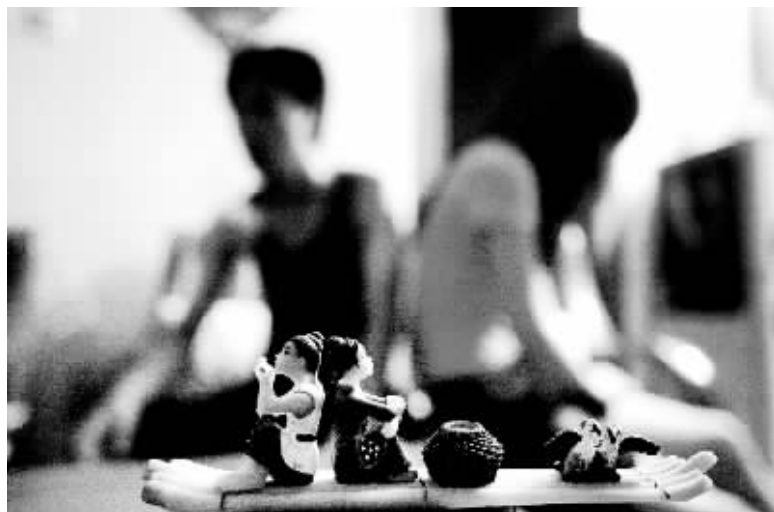
将现实的苦恼放到虚拟世界里解决，也许不失为一种抚慰失恋心灵的出路。