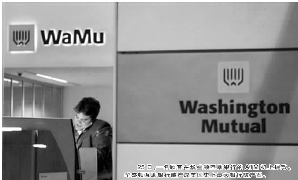
25日，一名顾客在华盛顿互助银行的ATM机上取款。华盛顿互助银行破产成美国史上最大银行破产案。