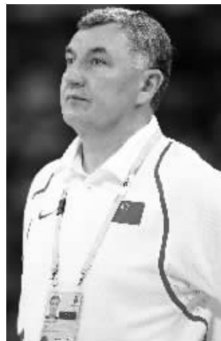
尤纳斯在带领中国男篮取得历史性突破的情况下宣布离开。