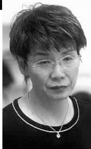
北京奥运会后,花泳“教母”井村雅代决定离开中国,为合同划上“句号”。