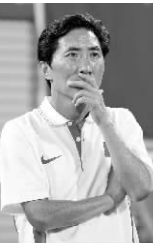
中国女曲的韩籍主教练金昶伯收到了韩国女曲的邀请,奥运会后去留未定。

备注:北京奥运会上,中国代表团中共有38名外籍教练,他们来自16个国家,分布在17个大项上,这些教练中有主帅也有分管教练。此处列出了12名知名教练,对他们的执教成绩进行了评判,除了中国男足的前任主教练杜伊科维奇外,其他主帅都取得了及格以上的成绩,9位教练更是以优良的成绩交出了一份令人满意的成绩单。