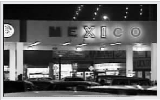
两人关系被发现后,仓皇逃到墨西哥。