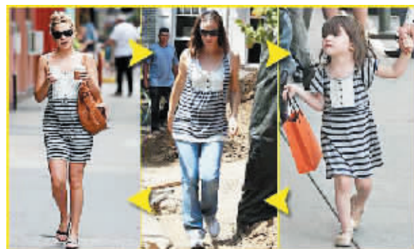
三位当今和未来的好莱坞巨星,谁穿着这件衣服更好看呢?

功“挤”走曾视她为情敌、去年排名第一的皮特前妻詹妮弗·安妮斯顿。“女凭母贵”的亲生女儿希洛也稳占第8位,超越“榜上无名”的星爸皮特。同样,靓老汤夫妇虽然未能入围,但经常曝光的女儿苏瑞却登上第7位。苏瑞也堪称全世界最时尚的小女孩,这不,她日前在纽约和妈妈一起购物时所穿的灰白条连衣裙,就曾经被凯特·哈德森和詹妮佛·加纳两大好莱坞女星穿过。