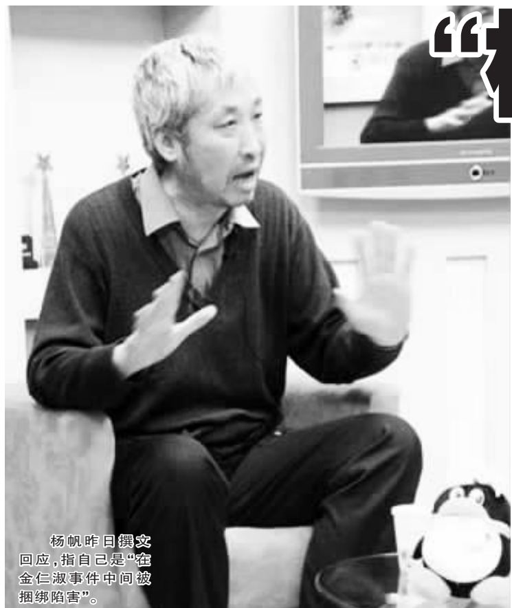
杨帆昨日撰文回应，指自己是“在金仁淑事件中间被捆绑陷害”。

政法大学负责学术规范事务处理的科研处有关负责人前天接受采访时表示，目前他正在外地，