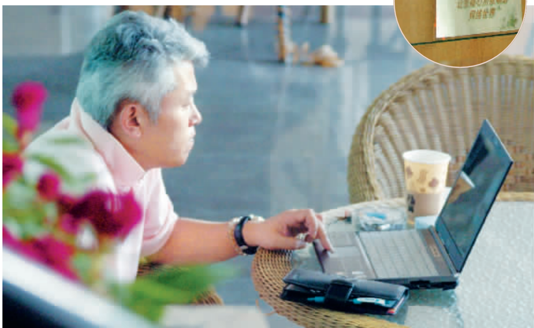
广州很多咖啡厅等消费场所都提供了无线上网服务，成为许多商务人士首选的第二工作室。

据了解，广州的 WIFI 技术发烧友还建起了一个叫“伙聚网”的网站，倡导“我为人人，人人为我”的无线网络理念，偶尔还会帮助咖啡店和餐饮机构提供 WIFI 解决方案赚点外快。