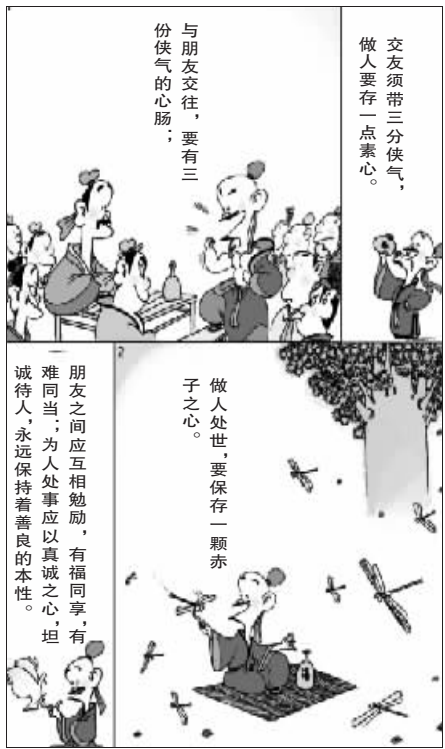
“蔡志忠典藏国学漫画系列”