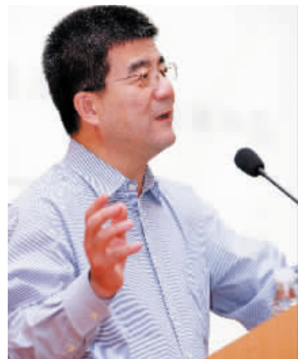
北京大学副校长、著名经济学家海闻为东莞150多位民营企业企业家上课。