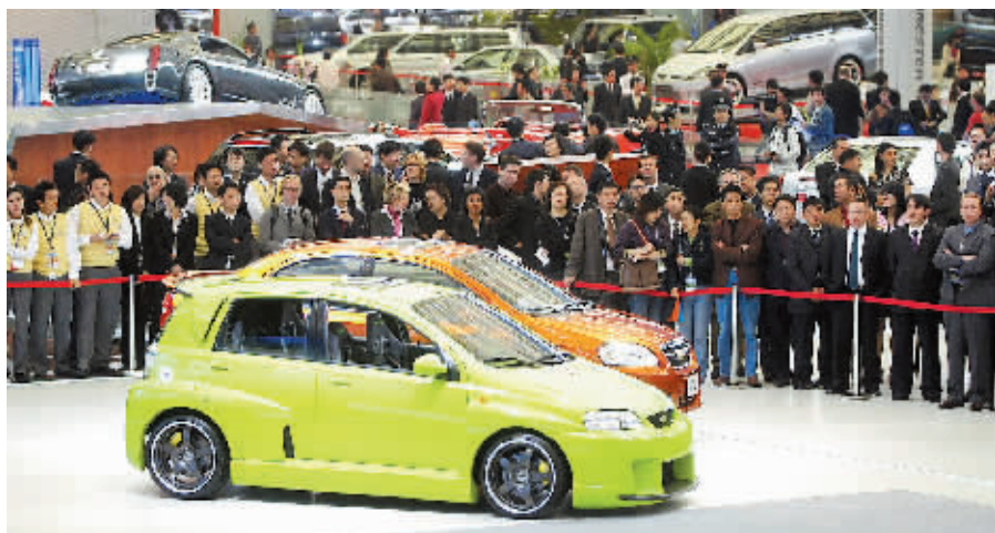
将有 20 多款首发车型亮相今年的广州车展。

海马 H11 上市后，将与福克斯两厢、世嘉等车型形成竞争关系，届时，海马一贯的性价比优势或将成为它冲击市场的一大利器。