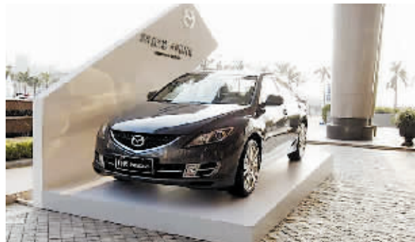
睿翼是一款针对新手驾驶者所推出的一款新车。

日前，一汽马自达宣布，在 MAZDA6 睿翼上市前，一汽马自达将为全国所有的一汽马自达专营店装配“秘密武器”。据了解，该“秘密武器”是一套完全模拟实车的人性化人机界面系统。用户无须进入车内，只需在展厅内就可以通过游戏的方式体验到睿翼性能。系统和赛车游戏类似，完全模拟真车，全部从日本进口。让消费者在试驾前感受睿翼所具备的“手不离方向盘、视线零转移，驾驶零难度”等特点。