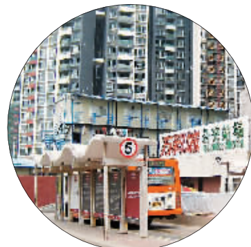
▲新里程楼下就是公交车站,交通方便。