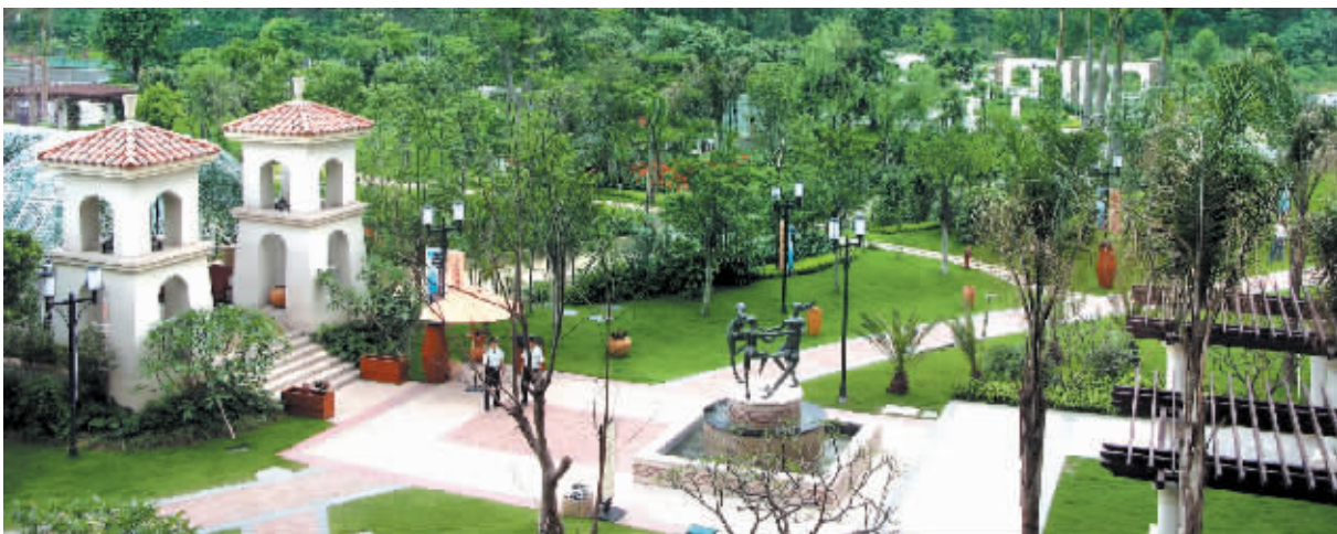
万科云山与130亩市政山体公园紧密相邻,是真正推窗见山、出门上山的山景社区。

本月22日,国家财政部、央行联合发文,出台新政鼓励市民置业,稳定房地产市场。在新政推出后的首个周末,广州万科即采取行动,在旗下金域蓝湾、万科云山、万科新里程三个楼盘中开展“理想家、零契税”活动,不仅为市场提供高品质的中小户型产品,而且让置业者享受更多实惠。从现场反映的情况来看,万科“理想家”受到市民、尤其是刚性置业者的热烈追捧。据悉,该活动将持续到11月2日,如果成交客户属于老业主介绍,双方还将有电器相赠。