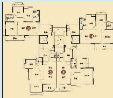
万科云山C1栋标准层

中小户型产品:75-95平方米的两房和三房 “理想家”+新政着数一览:(以95平方米的三房单位为例) 单位:B3-1501 原价:约90万 首付:约18万,比原来减少约9万元 契税:全免,比原来减少约1.35万元 印花税:免征,比原来减少约450元 20年月供(按标准利率上浮30%计算):约4000元/月,比原来减少约600元/月